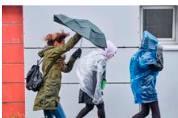
Búast má við rigningu víða um land.