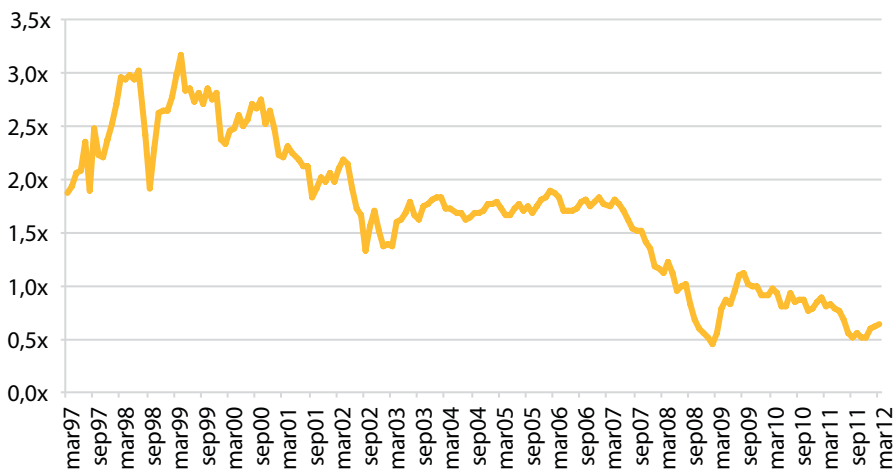
Mynd 1: Verð viðskiptabanka í Evrópu sem margfeldi af bókfærðu eigin fé árin 1997-2012

Segja má að forsendulaust, eða „blint“, virði hlutabréfa viðskiptabanka jafnist bókfærðu eigin fé þeirra. Ef markaðsverð er hærra, er verið að gefa sér forsendur um vöxt eða batnandi rekstrarskilyrði. Ef uppsett verð er lægra, er hins vegar verið að gefa sér forsendur um samdrátt eða versnandi rekstrarskilyrði. Sjá má verð evrópskra viðskiptabanka m.t.t. til eigin fjár á næstu mynd. Á myndinni sést að framangreint hlutfall hefur sveiflast mikið í gegnum tíðina, þannig hafa væntingar markaðsaðila um vöxt og rekstrarskilyrði á fjármálamarkaði breyst mikið undanfarin 15 ár. Á árunum 1997 til 2001, þ.e. á þeim tíma sem sala eignarhluta ríkisins var að hefjast, var verð viðskiptabanka m.t.t. eigin fjár á bilinu 2,0x til 3,0x, á árunum 2001 til 2008 1,5x til 2,0x, og á árunum 2008 til 2012 0,5x til 1,0x.